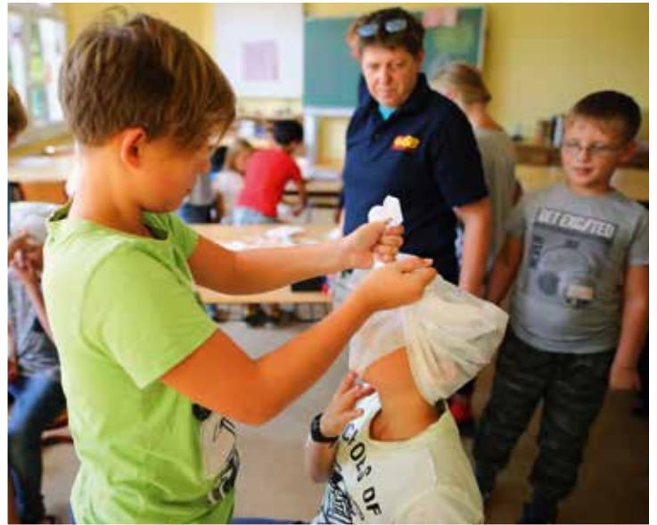
Schon Kinder lassen sich spielerisch für Erste Hilfe begeistern.

Um den Teilnehmerinnen und Teilnehmern die Krisenvorsorge möglichst realitätsnah zu vermitteln, lernen sie, Notfallvorräte selbst zu packen und einfache Wunden und Verbrennungen zu versorgen. Bei der Inszenierung einer Notsituation üben sie, einen kühlen Kopf zu bewahren und eine Überlebensstrategie zu entwickeln. Fragen wie „Was kann ich Essbares in der Natur finden?“ werden ebenso diskutiert wie: „Wie komme ich an Trinkwasser, wenn der Strom für mehrere Tage ausfällt?“