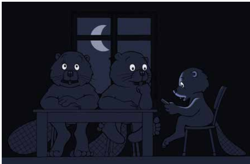
Auch beim ASBiber kann Stromausfall zur Krise werden.

Besonders brisant war die Situation für kranke und ältere Menschen: Das örtliche Krankenhaus ließ rund 40 Patienten aus der Intensivstation evakuieren, in einer Einrichtung für Betreutes Wohnen drohten mit Strom betriebene Beatmungsgeräte auszufallen. In dieser Notsituation kamen auch die Samariterinnen und Samariter des ASB Berlin zum Einsatz. Sie halfen bei der Verlegung der Patienten und stellten kostenfrei Strom für die Bevölkerung bereit. An einem ASB-Einsatzleitwagen konnten Bürger ihre Handys und andere elektrische Geräte aufladen. Eine junge Mutter brachte einen Wasserkocher vorbei, um Babymilch für ihr Kind zu erwärmen. „Man spürte in diesem Ausnahmezustand, wie sich die Menschen näherkamen und gegenseitig halfen“, berichtet der damalige Einsatzleiter Felix Kliche. „Menschen, die normalerweise nicht aufeinandertreffen, kamen plötzlich ins Gespräch und solidarisierten sich. Die gemeinsame Notlage erzeugte ein Gefühl von Zusammenhalt.“ >>