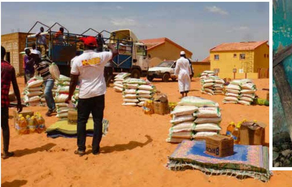
Derzeit verteilt der ASB Matten und Seife sowie Reis, Nudeln und Öl an über 250 Haushalte aus dem Überschwemmungsgebiet.