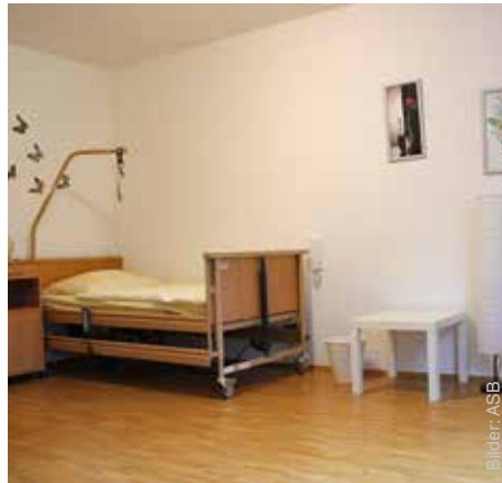
Ebenerdige, barrierefreie Wohnungen mit eigener Küche und Bad.

M an muss nicht ins hohe Alter kommen, um Hilfe bei der Pflege zu benötigen. Bereits eine überstandene Operation und/oder ein längerer Reha-Aufenthalt können Gründe dafür sein, kurzzeitig auf Unterstützung bei der Alltagsroutine angewiesen zu sein. Wenn auch Familie oder Freunde nicht einspringen können, ist der Weg zurück in die eigenen vier Wände manchmal kaum machbar.